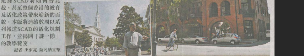
薩凡納藝術設計學院,前美軍兵工廠活化故事