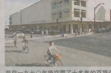
自一九七〇年後空置了十多年的百貨公司，被SCAD成功變身為圖書館。

眼見SCAD至今已成功活化薩凡納、亞特蘭大及Lacoste內逾一百幢古老建築，香港北裁作為