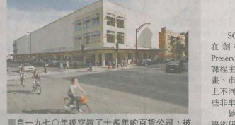
自一九七〇年後空置了十多年的百貨公司,被SCAD成功變身為圖書館。

眼見SCAD至今已成功活化薩凡納、亞特蘭大及Lacoste內逾一百幢古老建築,香港北裁作為