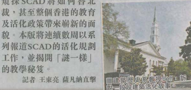
薩凡納藝術設計學院，前美軍兵工廠活化故事